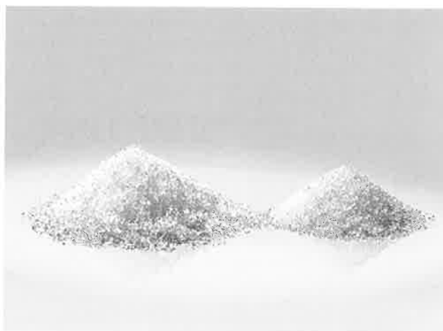
CRYSTAL CLEAR 0,7/1,3 MM, 15 KG SEKK Veil. pris inkl. mva. NOK: 290,-

For optimal filtrering anbefales det at sandfiltertanken fylles med en tredjedel Crystal Clear 1,0–3,0 mm i bunn. Restende to tredjedeler fylles med Crystal Clear 0,7–1,3 mm. Les mer om dette på side 64–65. Crystal Clear oppfyller standard EN 16713-1.